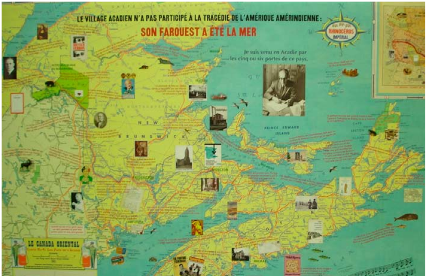
Ferron's imaginary Maritimes; map design by Luc Gauvreau and Irene Ellenberger

Roman à controverse, resté bien en vue depuis sa parution en 1978, The House of God présente un personnage principal, Roy Basch, médecin en première année d'internat, qui se met peu à peu à mépriser ses patients, se vengeant des conditions insoutenables qu'il doit lui-même subir en internat en se montrant de plus en plus inhumain en présence de ceux-ci. Shem renverse l'image de la sacro-