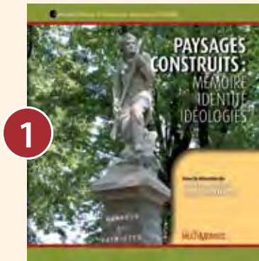
1 PAYSAGES CONSTRUITS: MÉMOIRE, IDENTITÉ, IDÉOLOGIE