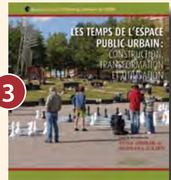
3 LES TEMPS DE L'ESPACE PUBLIC URBAIN : CONSTRUCTION, TRANSFORMATION ET UTILISATION