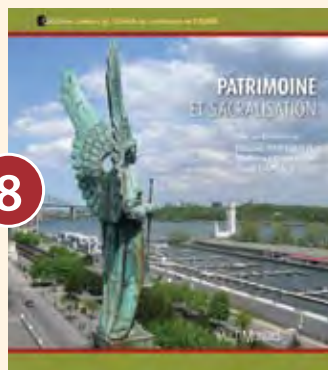
8 PATRIMOINE ET SACRALISATION

Commandez-les dès aujourd'hui/ Order Now!