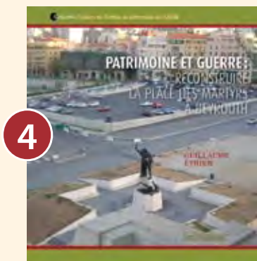
4 PATRIMOINE ET GUERRE: RECONSTRUIRE LA PLACE DES MARTYRS À BEYROUTH