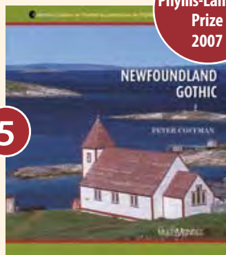
5 NEWFOUNDLAND GOTHIC