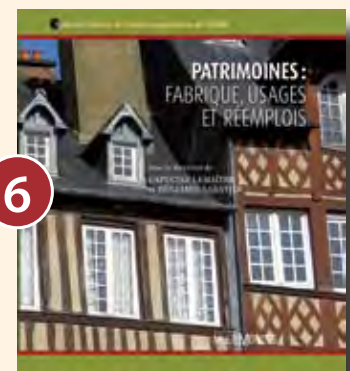
6 PATRIMOINES: FABRIQUE, USAGES ET RÉEMPLOIS