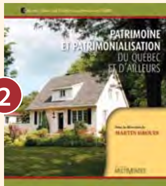
2 PATRIMOINE ET PATRIMONIALISATION DU QUÉBEC ET D'AILLEURS